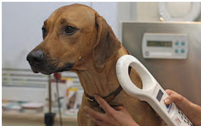
A kutyachip bőr alá juttatása és a leolvasó készülék használata.

A chip az állatok azonosítását könnyítené meg, hiszen ha minden kutyát ellátnak egy ilyen azonosító chippel, akkor az elszökött állatokat napokon belül vissza tudják juttatni az eredeti gazdihoz. Emellett a chipek segítségével pontos nyilvántartás készülhet az országban élő összes kutyáról. Az ebek számára eddig is kötelező volt bizonyos esetekben a chip. Például az Európai Unióban a kutyák gazdival történő utazásához vagy kereskedelméhez az állatútlevél mellett elengedhetetlen a chip megléte is. A chipeket a működési engedéllyel rendelkező állatorvos ülteti be, s ő veszi nyilvántartásba is az állatot. A mikrochip beültetése 3500 forintba kerül. Eddig csak a beoltott kutyákat tartották nyilván, viszont a nem beoltott ebekről semmilyen nyilvántartás nem létezett. Az új rendelet előírja, az önkormányzat háromévente köteles ebösszeírást végezni. Az országos adatbázis segítségével nem csak azt tudják kiszűrni, melyik eb van beoltva és melyik nincs, de nyilván a kóbor kutyák kérdése is rendeződhet.