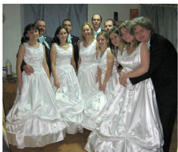
Az SzM-bál nyitótánc és a táncnyitók